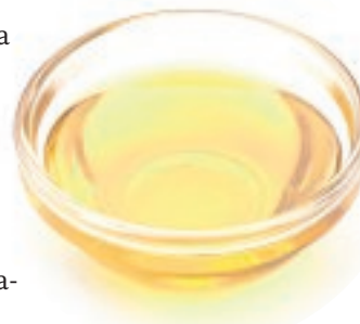
Aceite de girasol

Desde las asociaciones de consumidores avisan de que llueve sobre mojado porque los precios encadenan