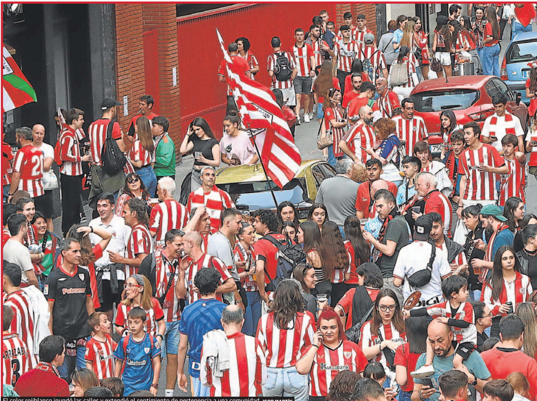
El color rojiblanco inundó las calles y extendió el sentimiento de pertenencia a una comunidad. IGOR MARTÍN