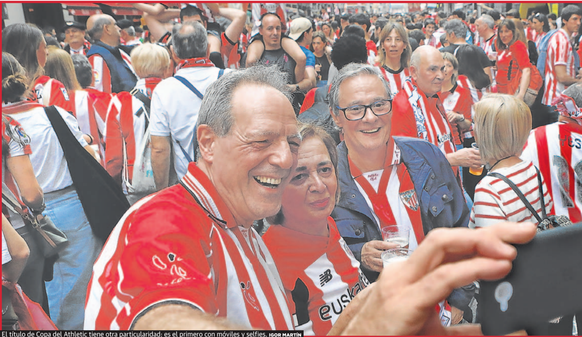
El título de Copa del Athletic tiene otra particularidad: es el primero con móviles y selfies. IGOR MARTÍN

que ver con la cultura vasca y el deporte, «pero, sobre todo, con una determinada identidad, que va más allá del sentimiento nacional, es más profundo, más transversal», remarca la socióloga, que también es profesora en la Universidad de Deusto. «El Athletic forma parte de la educación sentimental de los vizcaínos. Es lo que, por ejemplo, lleva a los padres a sacar del colegio a los niños para celebrar la Copa: quieren que vivan esa experiencia, que forme parte del legado que les dejan», remarca Del Campo. «Y el triunfo en la Copa es también el triunfo de una filosofía, de gente local y de dos chavales inmigrantes que se han integrado perfectamente y se han convertido en estrellas», apoya Bilbao.