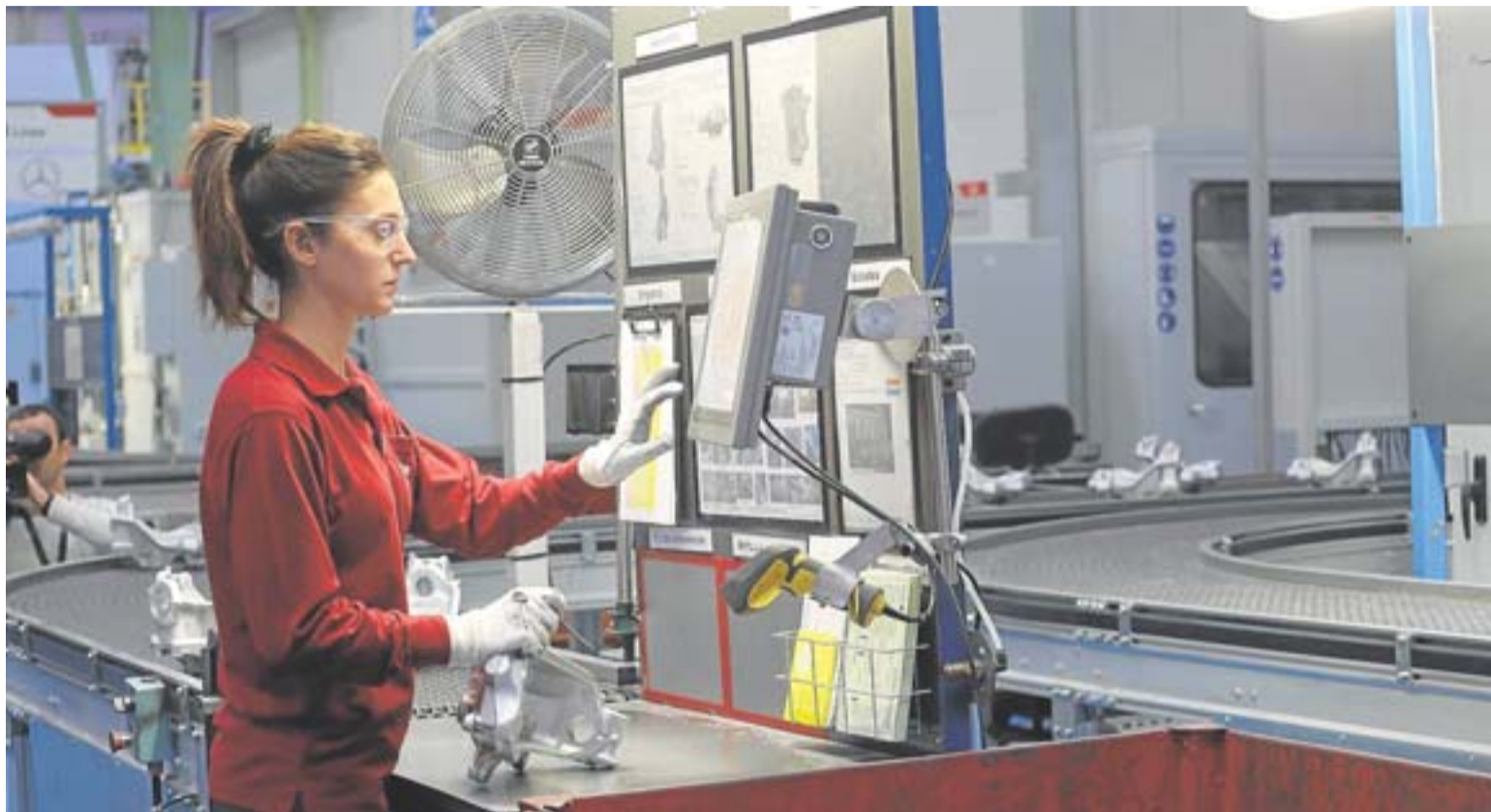
Una trabajadora de una planta industrial guipuzcoana. MIKEL ASKASIBAR